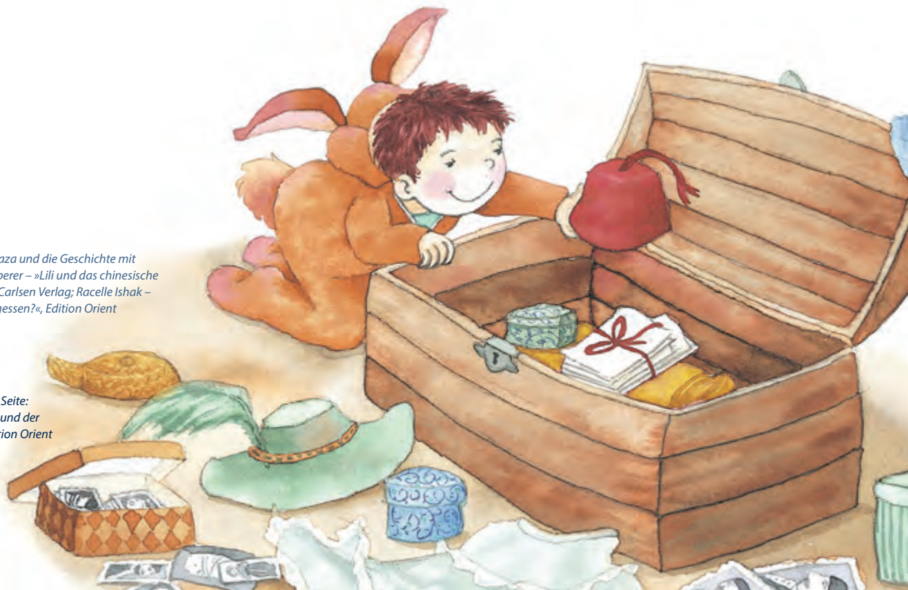
Illustration auf dieser Seite: Betül Sayın aus: Mert und der wundersame Fes, Edition Orient

Antje Flad – »Mwangaza und die Geschichte mit dem Zahn«, Sigrid Leberer – »Lili und das chinesische Frühlingsfest«, beide Carlsen Verlag; Racelle Ishak – »Wer hat mein Eis gegessen?«, Edition Orient