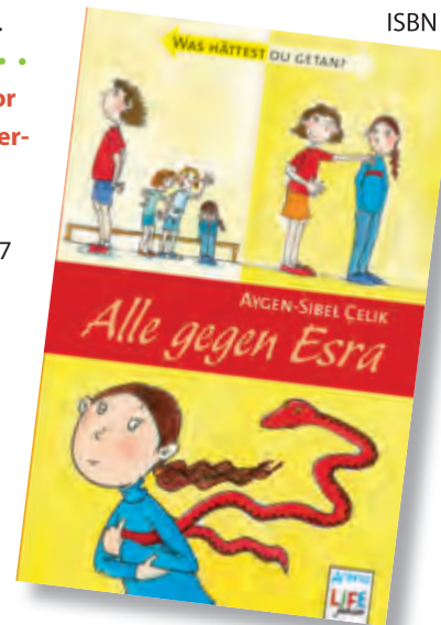
Illustration: Aygen-Sibel Çelik aus: Alle gegen Esra , Arena Verlag

Fabrizio Silei, Maurizio A. C. Quarello Verlag: Jacoby & Stuart Erscheinungsjahr: 2011 Preis: 14,95 € ISBN 978-3941787407