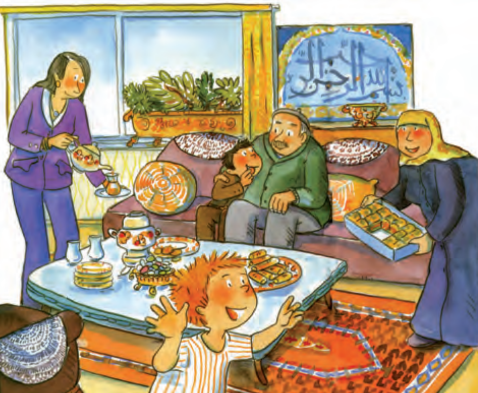
Illustration: Dorothea Tust, aus: Levent und das Zuckerfest, Carlsen Verlag

Deutsch-Türkisch Arzu Gürz Abay Verlag: Talisa Erscheinungsjahr 2016 Preis 13,95 € ISBN 978-3939619536