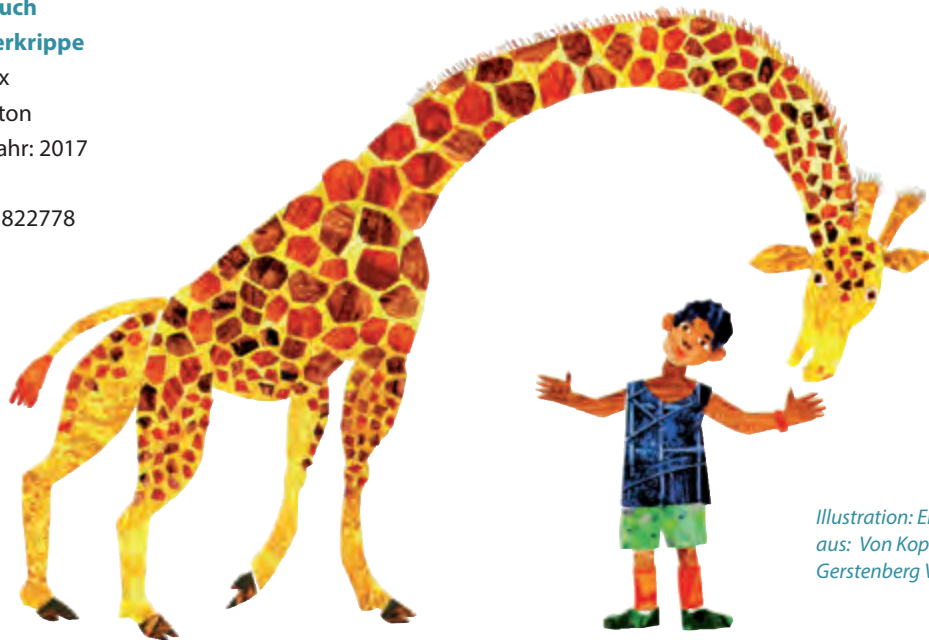
Illustration: Eric Carle aus: Von Kopf bis Fuß, Gerstenberg Verlag