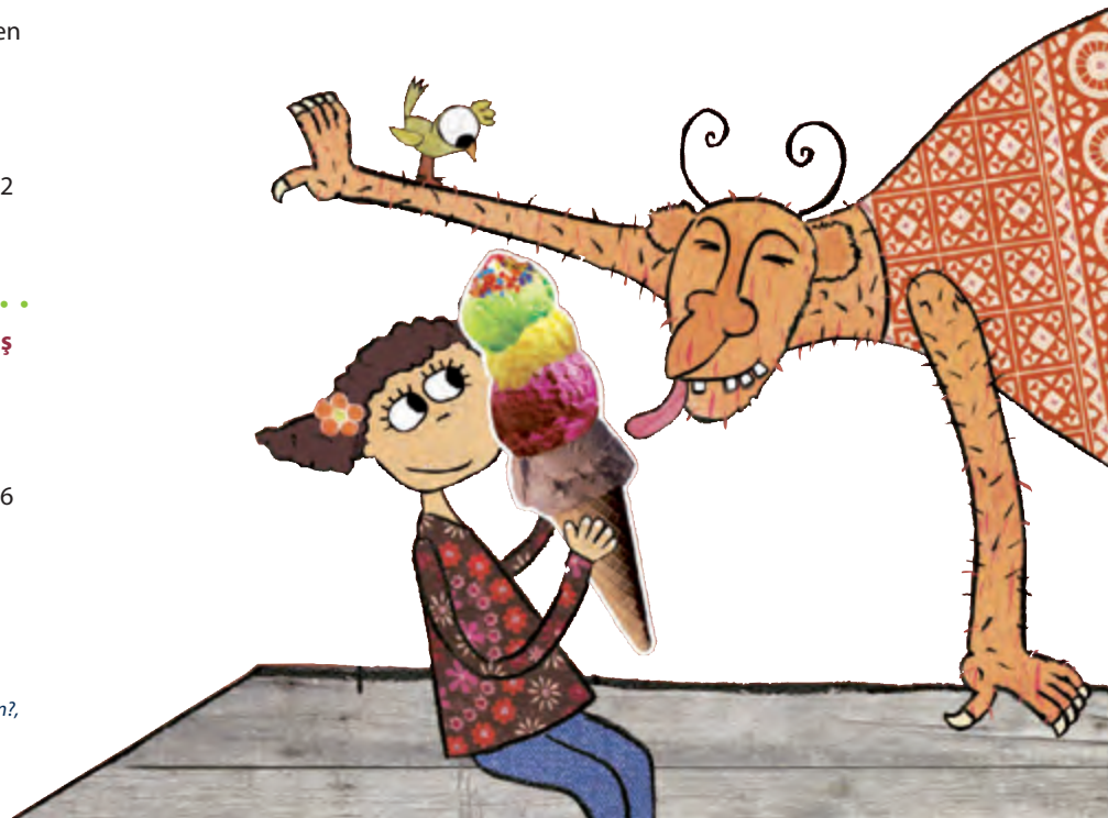
Illustration: Racelle Ishak aus: Wer hat mein Eis gegessen?, Edition Orient

Chinesisch-Deutsch Chen Chih-Yuan Nord Süd Verlag Erscheinungsjahr: 2010 Preis: 15,90 € ISBN 978-3314017575