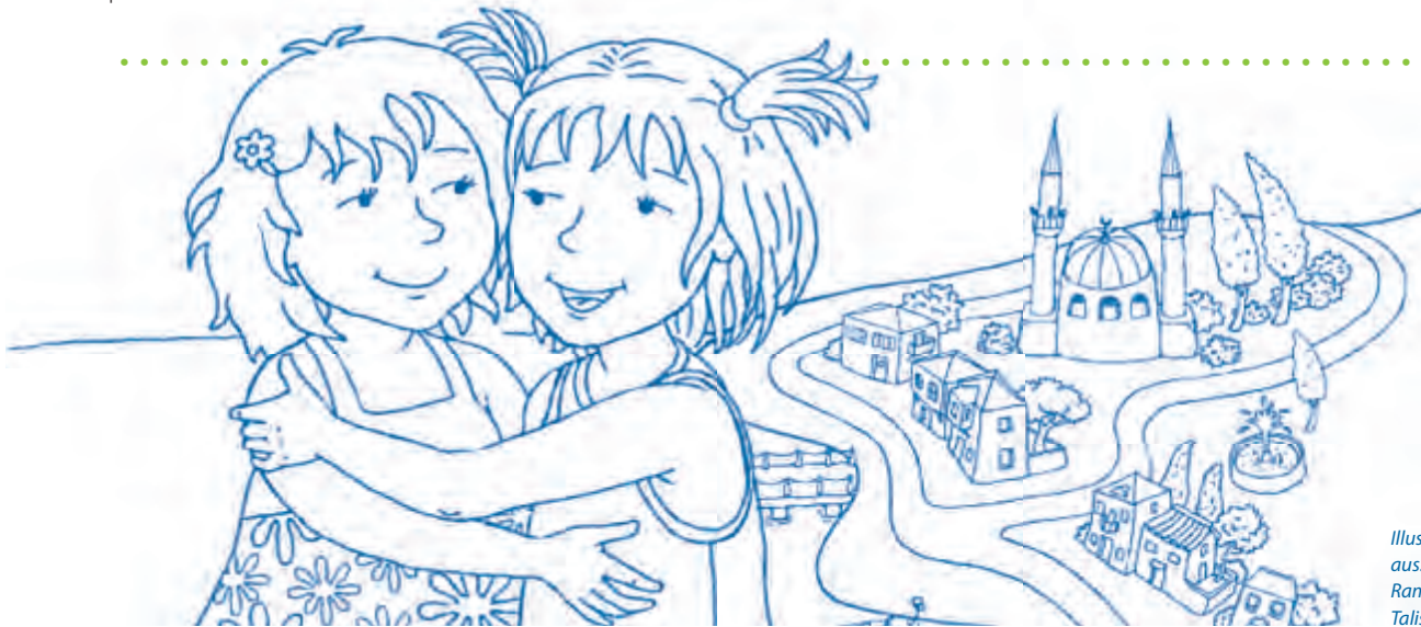
Illustration: Sibel Demirtaş aus: Leyla und Linda feiern Ramadan – Unterrichtsmaterial, Talisa Verlag

Es ist dann Aufgabe der Eltern und pädagogischen Fachkräfte, hier bewusst gegen zu steuern und die Kinder zu stärken.